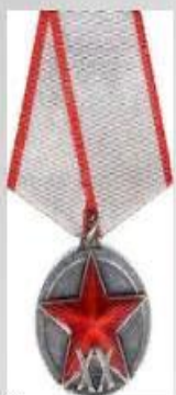
Юбилейная медаль «XX лет Рабоче-Крестьянской Красной Армии»