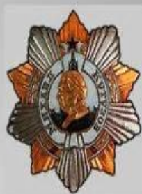
Орден Кутузова I степени