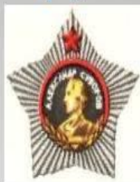
Орден Суворова I степени