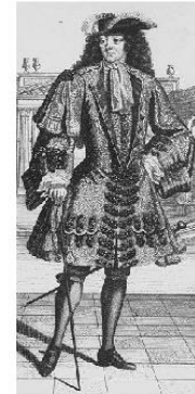
Аристократ эпохи Петра I

Чтобы бояре не претендовали на высшие должности и особое положение. Петр принял Указ о единонаследии. По этому указу боярские вотчины были приравнены к дворянским поместьям. Поместья разрешалось передавать по наследству только одному наследнику – старшему сыну. Остальные должны служить на государственной службе и получать за это жалованье.